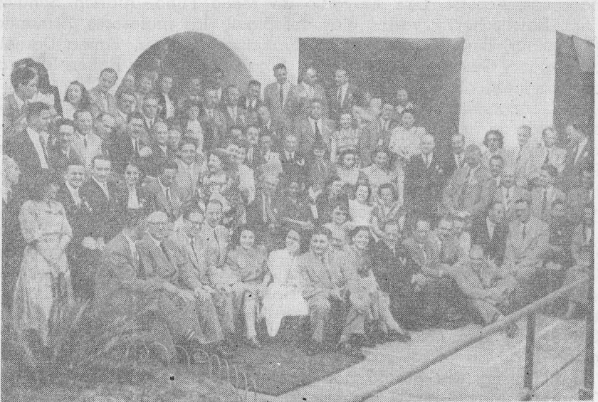
Conjunto de congresales argentinos.