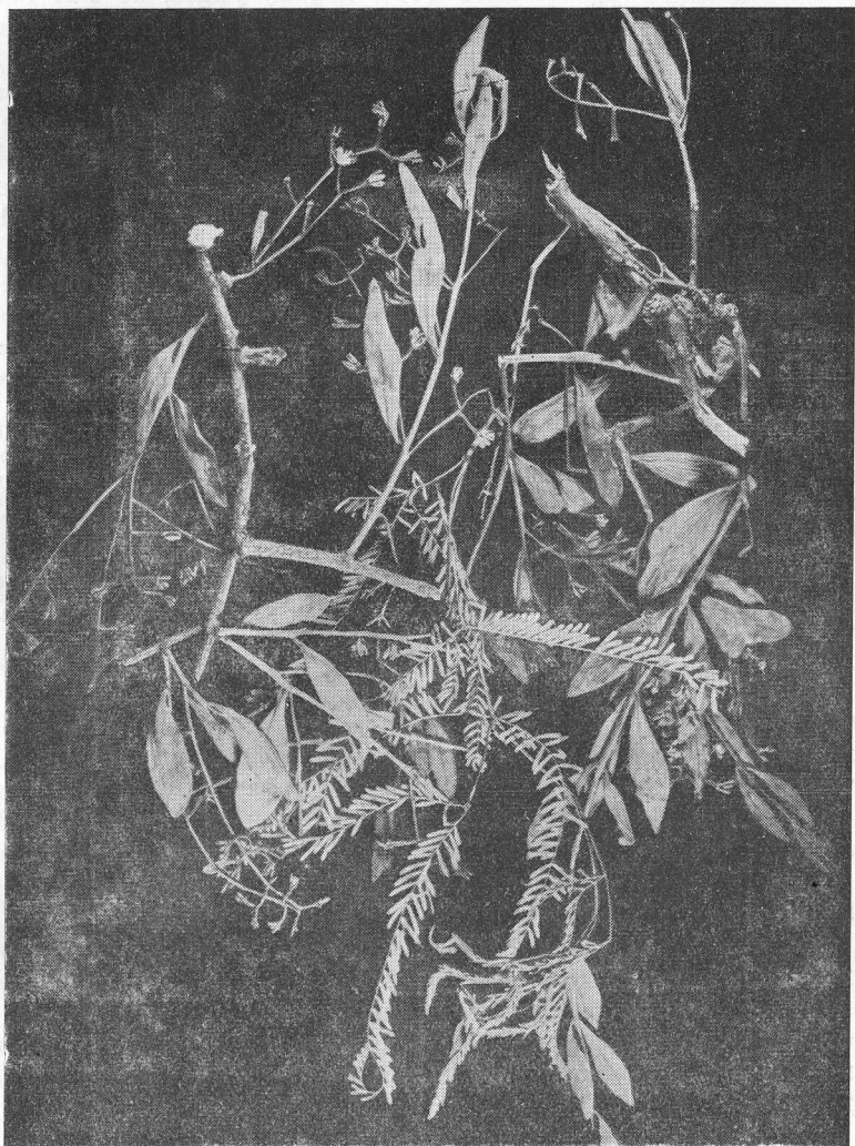
Lam. I.— Struthanthus llanensis Ruiz Leal. Typus: Provincia de La Rioja, Departamento de General Belgrano, Castro Barros.

mando un cuerpo subcónico de 20 mm de base por 17 mm de alto del que salen ramitas de 20-30 cm de largo por 3-6 mm de diámetro; corteza rugoso-resquebrajada, estriada, rojizo-grisácea; entrenudos de 15-30 mm. Hojas opuestas elípticas o elíptico-lanceoladas, derechas, de