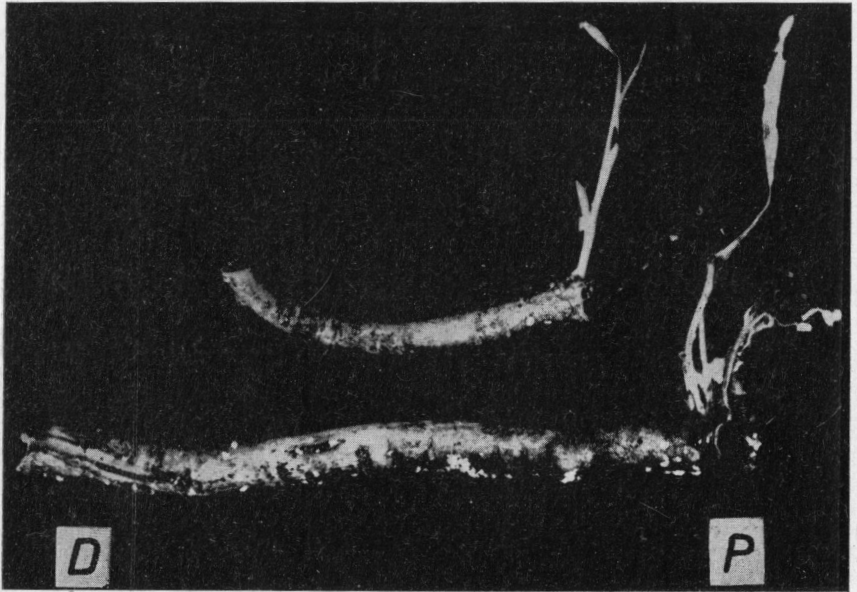
Fig. 2. — Segmentos de raíz, de 5 y 10 cm de longitud colocados a regenerar en posición horizontal. Obsérvese que en el segmento más largo se alargaron varias yemas adventicias. P : extremo proximal ; D : extremo distal.

alargamiento de las yemas, dado que si bien podían haberse formado varias, sólo una se alargó hasta alcanzar varios centímetros de longitud; el resto no superó una extensión de 1-2 mm de largo. En cambio, en los segmentos más largos podían haberse alargado más de una yema, tal como se muestra en la figura 2. En todos los casos, la formación de yemas precedió a la formación de raíces.