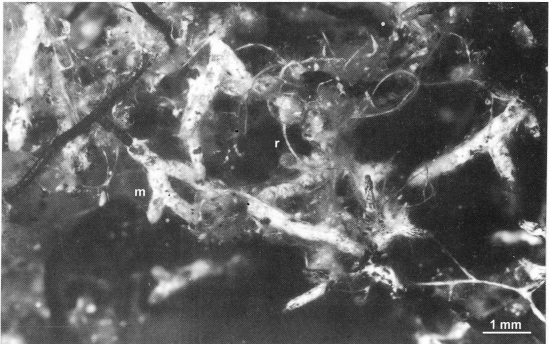
Fig. 2. Detalle del sistema micorrícico dicotómico formado por Pinus elliotii y Suillus granulatus . m: manto fúngico; r: rizomorfos blancos.

Las ectomicorrizas se reconocieron por sus características morfológicas externas, tales como: color blanco opaco con áreas castaño claro, ramificaciones laterales cortas generalmente dicotómicas, algunas apretadas y de apariencia coraloide (Fig. 2). Manto compuesto por tres capas, la externa plecten-