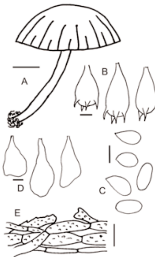
Fig. 3. Mycena subtenerima . A- aspecto general del basidiocarpio, B- basidios, C- esporas, D- queilocistidios, E- pileipellis. Barra: A: 2 \mu m; B-D: 5 \mu m; E: 10 \mu m.

Observaciones. Especie que se caracteriza por su