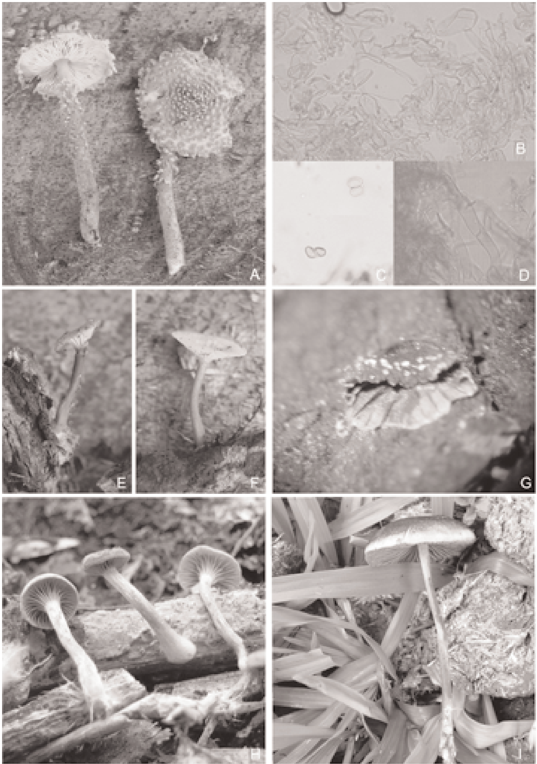
Fig. 4. A-D- Cystolepiota adulterina ; A- aspecto general del basidioma; B- elementos de la pellis; C- esporas; D- hifas del contexto; E-F- Clitocybe asema ; G- Resupinatus striatulus ; H- Clitocybe aprilis ; I- Panaeolus subbalteatus .