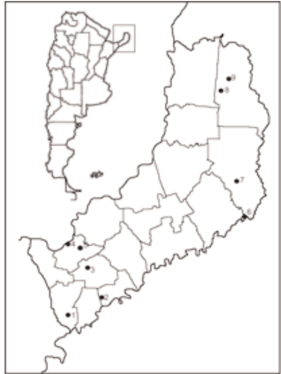
Fig. 1. Localidades de colección: 1- Tres Capones, 2- Ruinas Jesuíticas de Sta. María, 3- Bonpland, 4- Santa Ana, 5- P.P. Teyú-Cuare, 6- P.P. Moconá, 7- P.P. Esmeralda, 8- P.P. Urugua-í, Puesto Uruzú, 9- P.P. Uruguaí, Puesto 101.

Píleo 4-6 mm de diám., convexo, con el centro