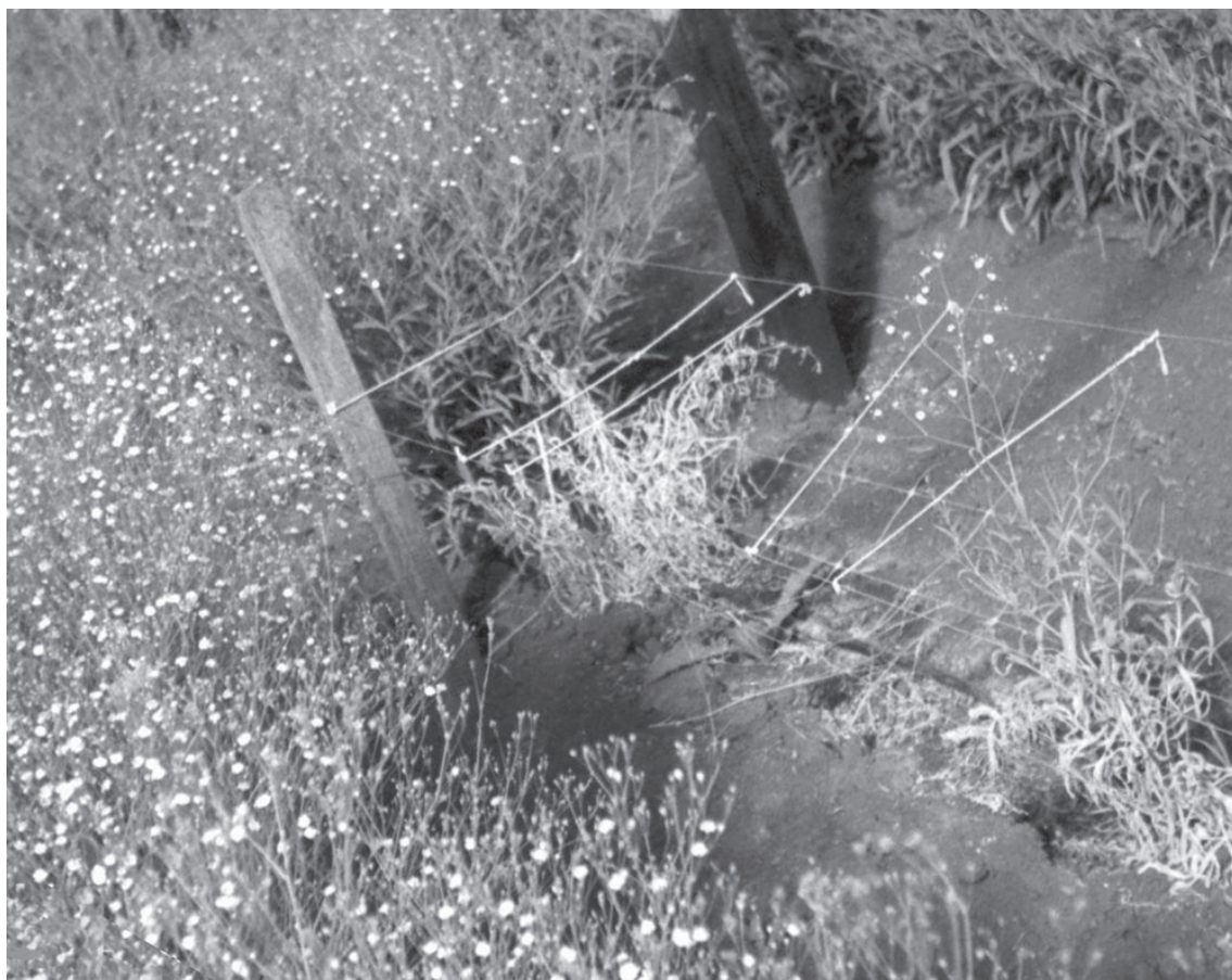
Fig. 2. Cantero con plantas en floración y manchón improductivo con plantas afectadas por podredumbre de la corona.

slerotiorum , Rhizoctonia solani , Alternaria dianthi , F. solani asociado con F. oxysporum y F. verticillioides como los patógenos causantes de la podredumbre basal del clavel. En todos los casos se presentaban acompañados por otras especies de Fusarium que no resultaron virulentas (Wolcan et al. , 1999).