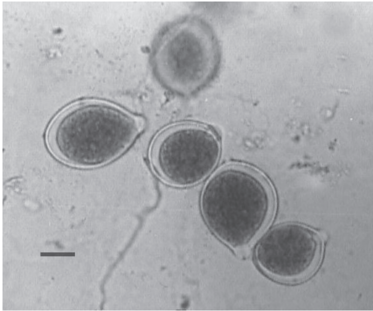
Fig. 4. Esporangios papilados de P. nicotianae cultivada en APG (barra = 15 \mu m).

Aislamientos y pruebas de patogenicidad: Como se observa en la Tabla 1, a partir de plantas de gipsofila con podredumbre en la base de los tallos se aisló predominantemente F. graminearum , el único que resultó patogénico en las inoculaciones, observándose diferente grado de virulencia y agresividad entre las cepas probadas. Cuando se infestó el suelo algunas cepas fueron inocuas y otras produjeron un decaimiento inicial de plantas que posteriormente se recuperaron. Cuando las plantas se inocularon en lesiones de los tallos (en la base o en el ápice), con algunas cepas de distinta procedencia el resultado fue similar, produciéndose en la mayoría de los casos la muerte de las plantas o de algunas ramas. Los síntomas comenzaron entre los 7 y 12 días.