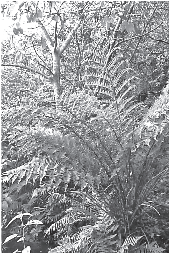
Fig.2. Individuo de Cyathea atrovirens en Rincón Ombú, creciendo en el sotobosque.