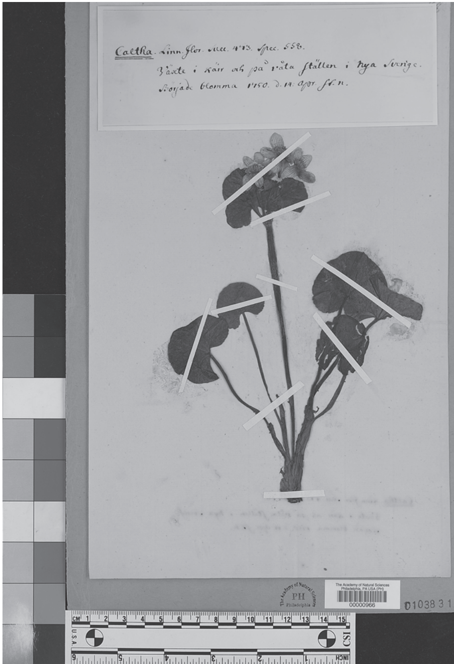
Fig. 1. Especimen de Caltha palustris L. (Ranunculaceae) estudiado por Linneo y recolectado por Peter Kalm en 1750. Fuente: Herbario PH, Academia de Ciencias Naturales de Filadelfia.

York, promovió el principio de prioridad de publicación, así como de la aplicación de tipos nomenclaturales. En dicho siglo también tuvo lugar la creación de muchos herbarios en los Estados Unidos (Tabla 2).