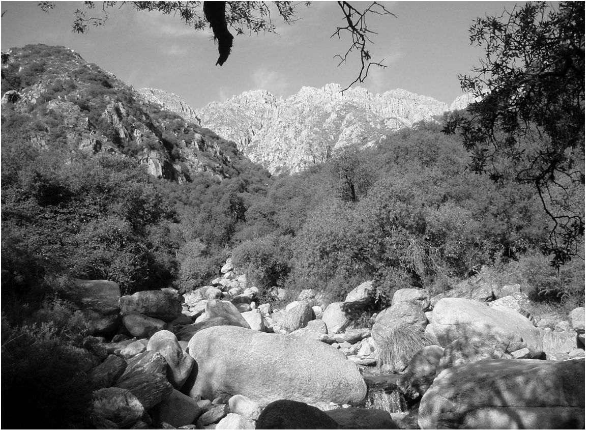
Fig. 2. Ambiente característico de las Sierras de Comechingones, Provincia de San Luis.

Adiantum lorentzii Hieron., Bot. Jahrb. Syst 22: 393.1896.